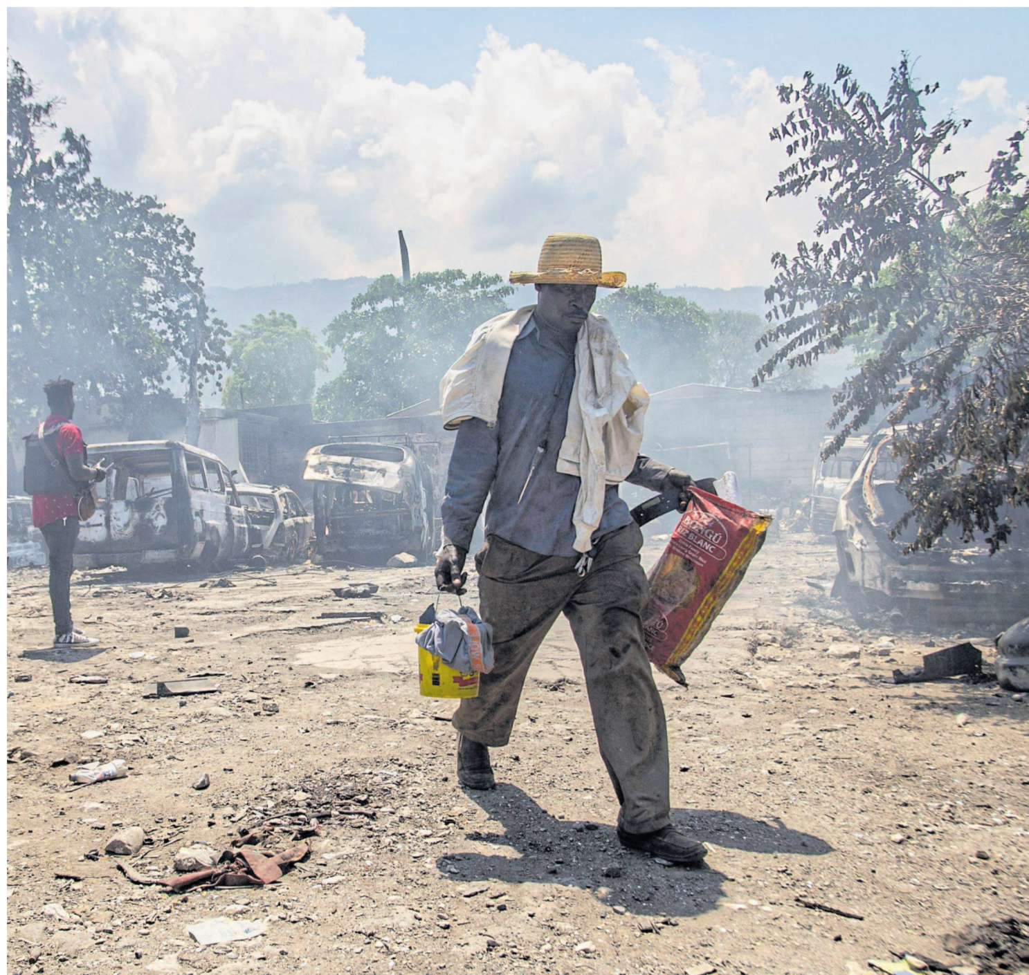
Retten, was zu retten ist: In der Hauptstadt Port-au-Prince regiert das Chaos der kriminellen Banden.